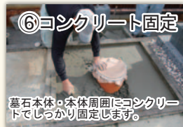
⑥ コンクリート固定