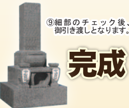
⑨ 細部のチェック後、御引き渡しとなります。